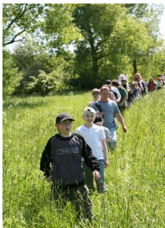
„Krajina plná andělů“