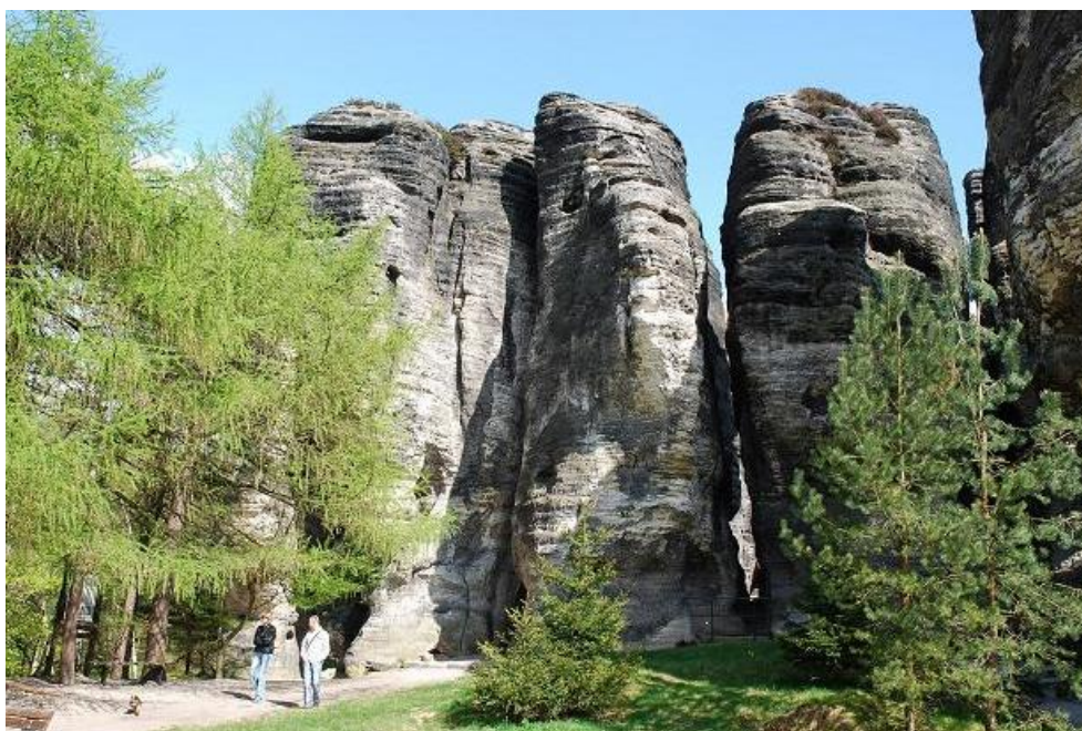
Jedinečné skalní útvary Tiských stěn