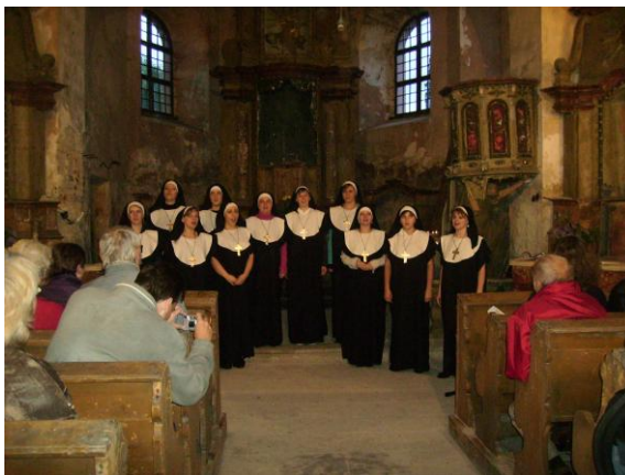
Vystoupení sboru ZUŠ Evy Randové v Čermné - kostel sv. Mikuláše

Na „Ostrov“ navazují hned dva projekty: „Naše živé kostelíky“ (další série kulturních programů) a „Ostrovní akademie“ (soubor populárně-naučných přednášek).