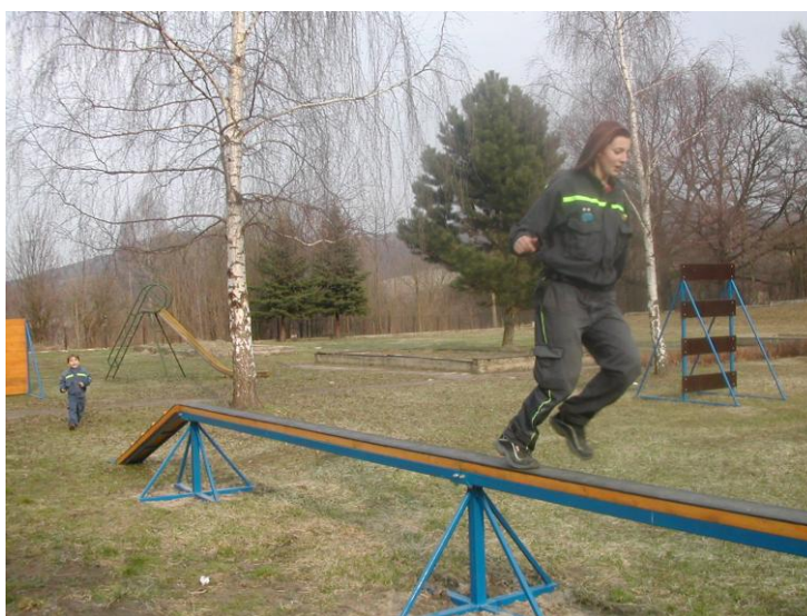
Překážková dráha pro mladé hasiče – SDH Jílové-Modrá

Monitorovací výbor provádí návštěvy u žadatelů v místě realizace a působí jako poradní orgán, aby nedošlo k nějakému pochybení ze strany žadatele. Žadatel má možnost se ptát na věci, které mu případně nejsou v souvislosti s realizací jasné. Kontroluje termín a místo realizace projektu, zadávací řízení apod.. V roce 2010 proběhly návštěvy monitorovacího výboru u žadatelů 2x v červenci, 1x v září a 1x v říjnu.