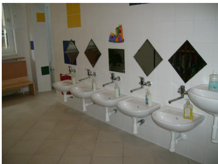
Rekonstruovaná umývárna v MŠ v Tisé