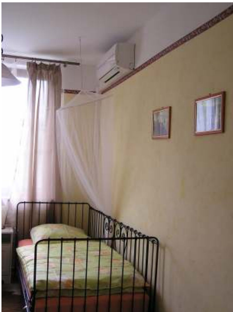
Ekofarma Natural Agro Slavošov – ubytování a vytápění pokojů (2 projekty)

Monitorovací výbor provádí návštěvy u žadatelů v místě realizace a působí jako poradní orgán, aby nedošlo k nějakému pochybení ze strany žadatele. Žadatel má možnost se ptát na věci, které mu případně nejsou v souvislosti s realizací jasné. Kontroluje termín a místo realizace projektu, zadávací řízení apod.. V roce 2011 proběhly návštěvy monitorovacího výboru u žadatelů v 1x v lednu, 1x v červenci a 1x v září.