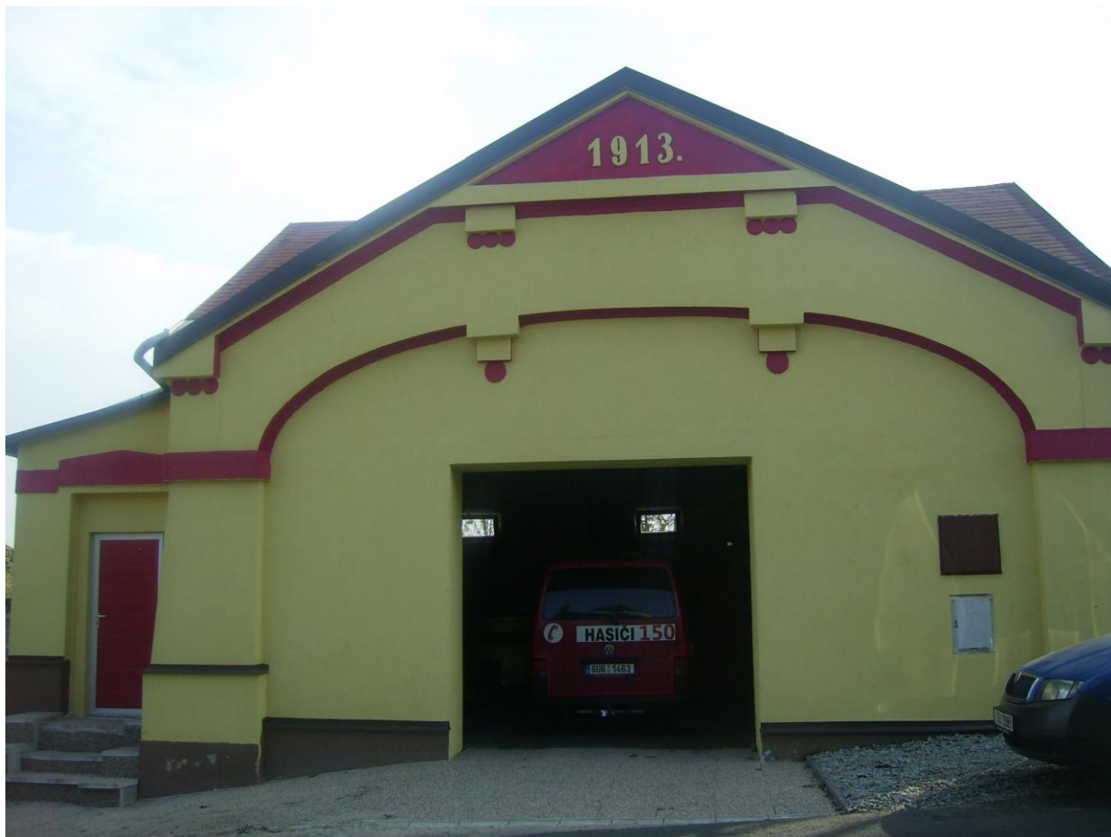
Opravená Hasičská zbrojnice v Tisé ( 7. Výzva MAS)