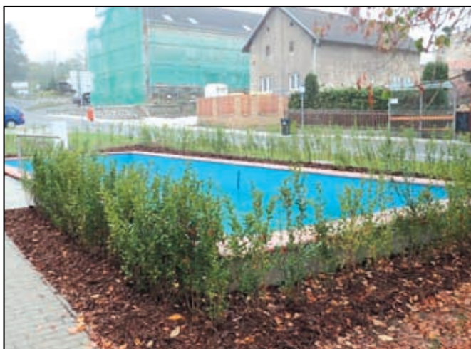
Výsadba na návsi v Malšovících

2. Revitalizace sídelní zeleně v katastru obce Malšovice, žadatel obec Malšovice, náklady 1 186 100,- Kč, akce byla realizována v letošním roce a žadatele čekají tři následné péče o výsadby, které jsou rovněž součástí dotace. Jednalo se o obnovu zeleně na návsi v Malšovících a Javorech a výsadbu alejí v intravilánu obce Malšovice.