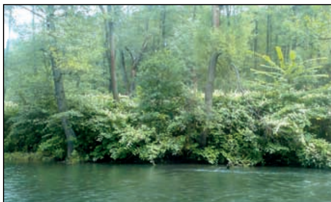
Výskyt křídlatky podél vodních toků

3. Likvidace křídlatky na Benešovsku a osvětová činnost, žadatel Sdružení obcí Benešovska, náklady 1 005 534,- Kč. Akce je schválena, v současné době se připravuje výběrové řízení na dodavatele, samotná realizace pak bude zahájena v roce 2021 a bude trvat tři roky. Cílem akce je likvidace křídlatky na ucelené lokalitě Benešovska a seznámení veřejnosti s problematikou křídlatky, jako invazního druhu prostřednictvím osvěty.