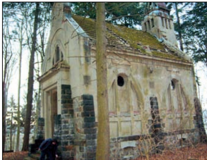
Původní stav v roce 2017