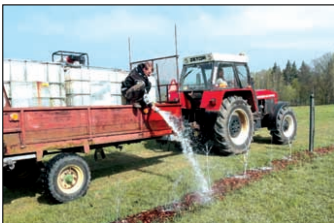
Následná péče o vysazené dřeviny

2. Revitalizace sídelní zeleně v katastru obce Malšovice, žadatel obec Malšovice, náklady 1 186 100,- Kč, akce byla realizována v letošním roce a žadatele čekají tři následné péče o výsadby, které jsou rovněž součástí dotace. Jednalo se o obnovu zeleně na návsi v Malšovících a Javorech a výsadbu alejí v intravilánu obce Malšovice.