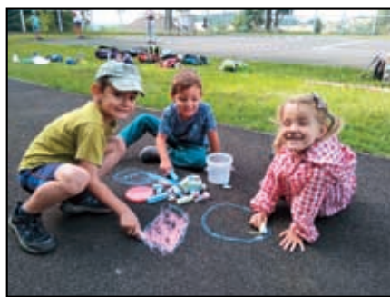
Příměstský tábor Tisá

Komunitní centrum Povrch v letošním roce, kdy je setkávání na komunitní úrovni v důsledku covidové pandemie omeze-