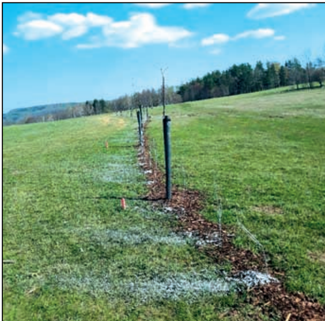
Ovocné stromořadí s podsadbou keřů