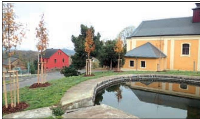
Výsadba na návsi v Javorech