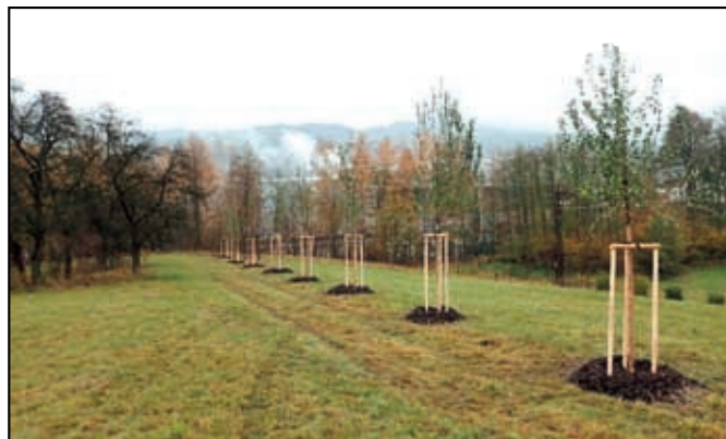
Výsadba alejí v intravilánu obce Malšovice

3. Likvidace křídlatky na Benešovsku a osvětová činnost, žadatel Sdružení obcí Benešovska, náklady 1 005 534,- Kč. Akce je schválena, v současné době se připravuje výběrové řízení na dodavatele, samotná realizace pak bude zahájena v roce 2021 a bude trvat tři roky. Cílem akce je likvidace křídlatky na ucelené lokalitě Benešovska a seznámení veřejnosti s problematikou křídlatky, jako invazního druhu prostřednictvím osvěty.