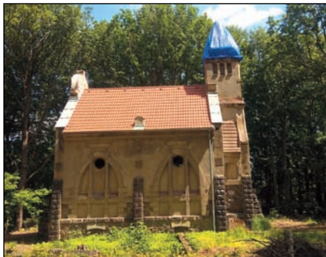
Rekonstrukce střechy v roce 2019

Zaujalo Vás to? Rádi byste se na záchraně podíleli? Je možné zaslat finanční dar na účet u KB a.s. 115-5207170237/0100 - uzavřeme s Vámi darovací smlouvu a vystavíme potvrzení o daru - kontaktujte nás prosím. Další informace o dění kolem kaple na fcb profil kaplelibouchec a na www.kaplelibouchec.cz